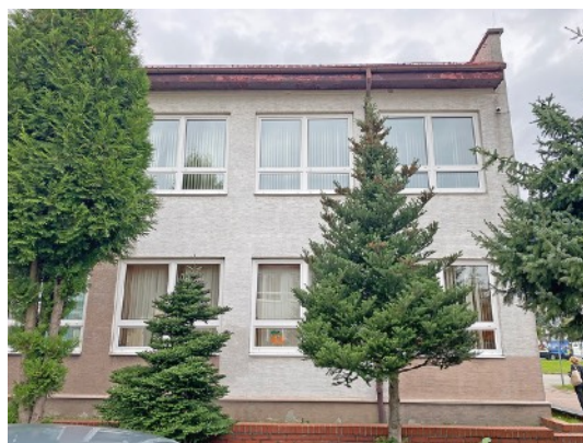
Fot. 30,31. Szkoła Podstawowa nr 36 przy ul. Sztolniowej 29B w Boguszowicach Starych.