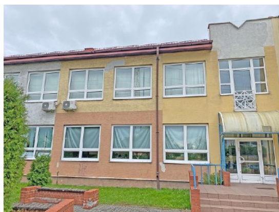
Fot. 34,35. Szkoła Podstawowa nr 36 przy ul. Sztolniowej 29B w Boguszowicach Starych.