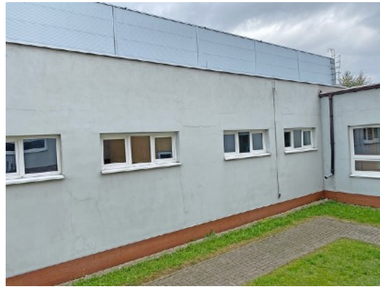
Fot. 14,15. Szkoła Podstawowa nr 36 przy ul. Sztolniowej 29B w Boguszowicach Starych.