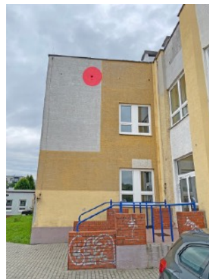
Fot. 18,19. Szkoła Podstawowa nr 36 przy ul. Sztolniowej 29B w Boguszowicach Starych. Zaznaczono siedliska lęgowe kawki - czerwone punkty.