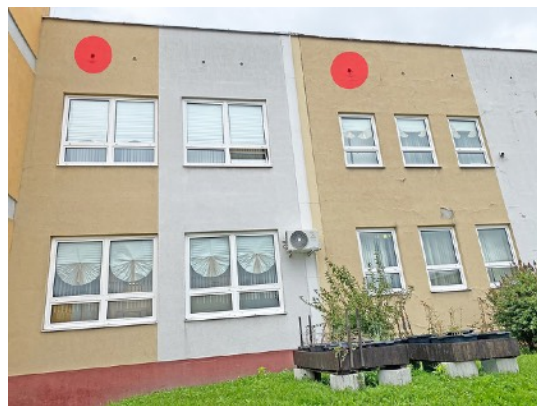
Fot. 16,17. Szkoła Podstawowa nr 36 przy ul. Sztolniowej 29B w Boguszowicach Starych. Zaznaczono siedliska lęgowe kawki - czerwone punkty.