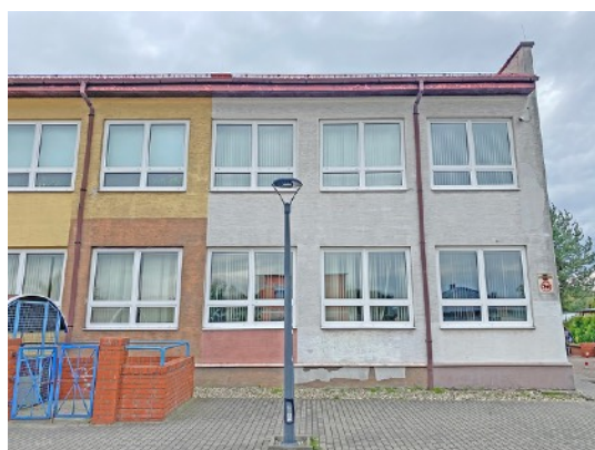
Fot. 22,23. Szkoła Podstawowa nr 36 przy ul. Sztolniowej 29B w Boguszowicach Starych.