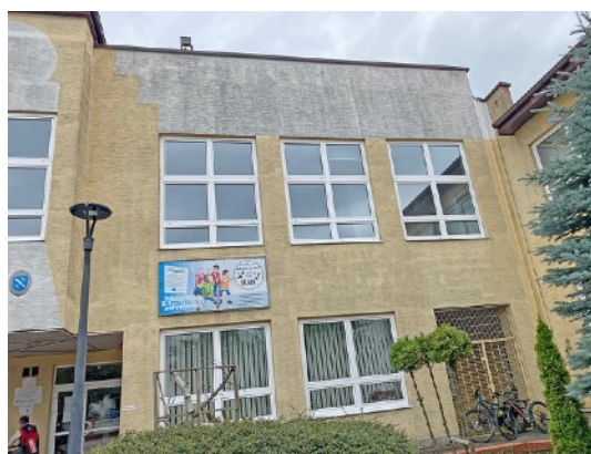
Fot. 28,29. Szkoła Podstawowa nr 36 przy ul. Sztolniowej 29B w Boguszowicach Starych.