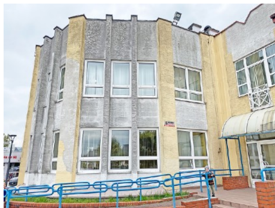
Fot. 20,21. Szkoła Podstawowa nr 36 przy ul. Sztolniowej 29B w Boguszowicach Starych.