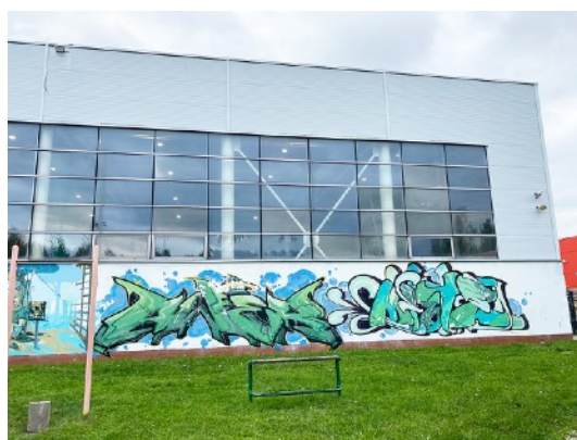
Fot. 10,11. Szkoła Podstawowa nr 36 przy ul. Sztolniowej 29B w Boguszowicach Starych.