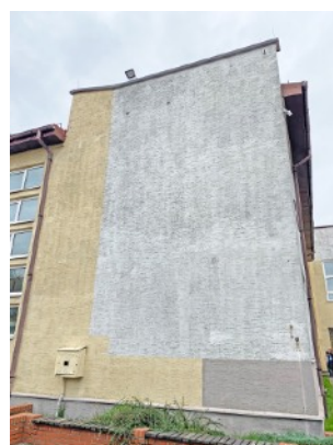
Fot. 24,25. Szkoła Podstawowa nr 36 przy ul. Sztolniowej 29B w Boguszowicach Starych.