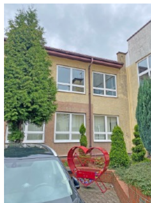
Fot. 26,27. Szkoła Podstawowa nr 36 przy ul. Sztolniowej 29B w Boguszowicach Starych.