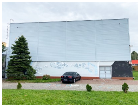
Fot. 8,9. Szkoła Podstawowa nr 36 przy ul. Sztolniowej 29B w Boguszowicach Starych.