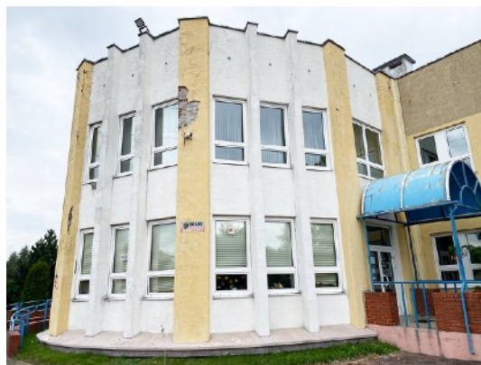
Fot. 2,3. Szkoła Podstawowa nr 36 przy ul. Sztolniowej 29B w Boguszowicach Starych.