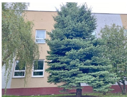
Fot. 4,5. Szkoła Podstawowa nr 36 przy ul. Sztolniowej 29B w Boguszowicach Starych.