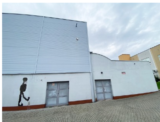
Fot. 12,13. Szkoła Podstawowa nr 36 przy ul. Sztolniowej 29B w Boguszowicach Starych.