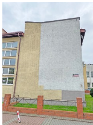
Fot. 32,33. Szkoła Podstawowa nr 36 przy ul. Sztolniowej 29B w Boguszowicach Starych.