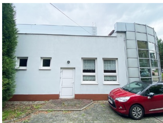
Fot. 6,7. Szkoła Podstawowa nr 36 przy ul. Sztolniowej 29B w Boguszowicach Starych.